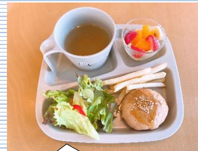
③ 豚ボール +ポテト・野菜スープ・果物