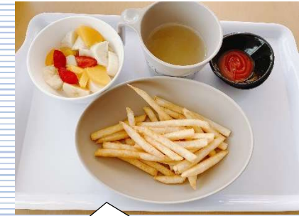
② ポテト +野菜スープ・果物