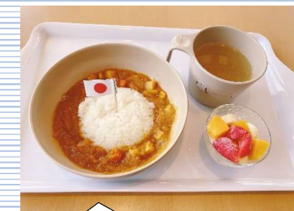
④ カレー(低アレルギー) +野菜スープ・果物