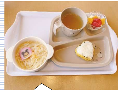
① うどん +おにぎり・果物